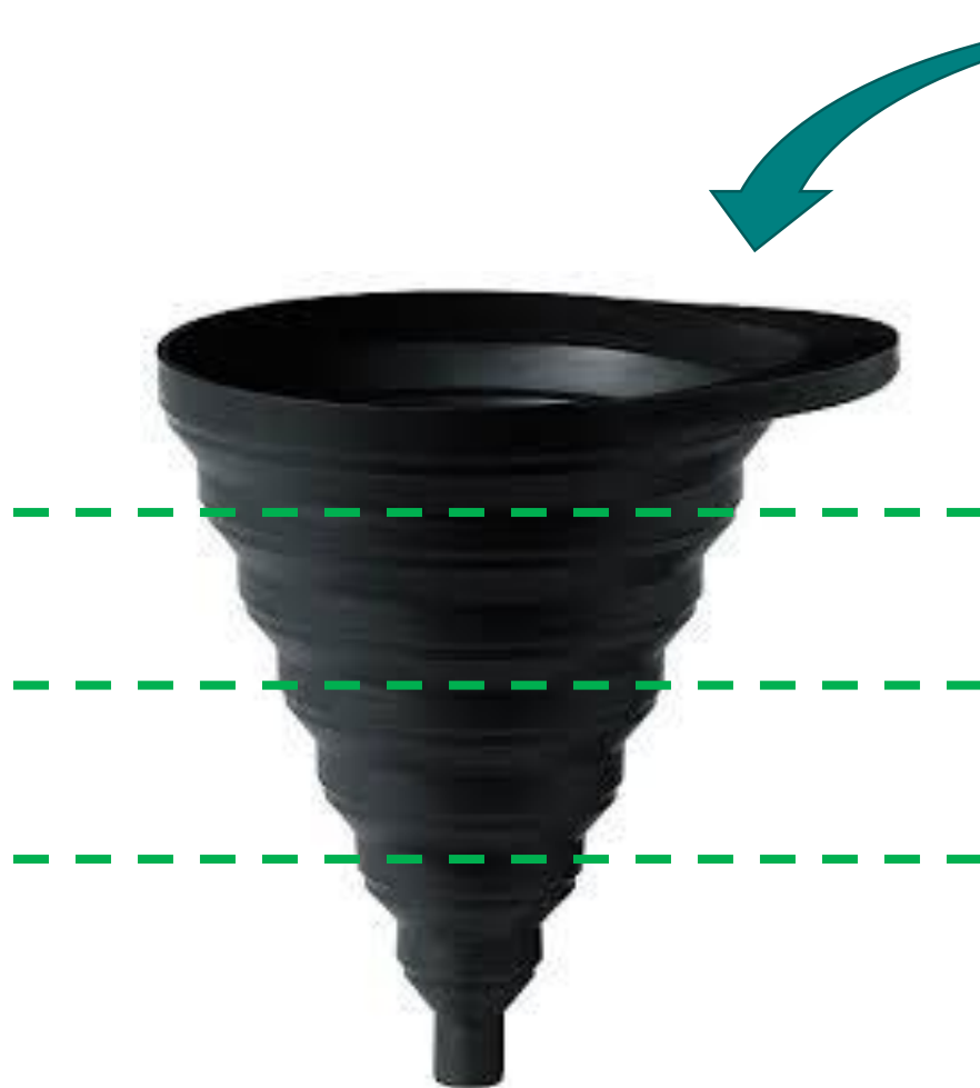
Strategi 2017 - 2020

Vi har gennem de seneste 6 måneder - med afsæt i en bruttoliste af temaer – skabt strategien med inddragelse af bestyrelse, koordinatore og temagruffeformænd.