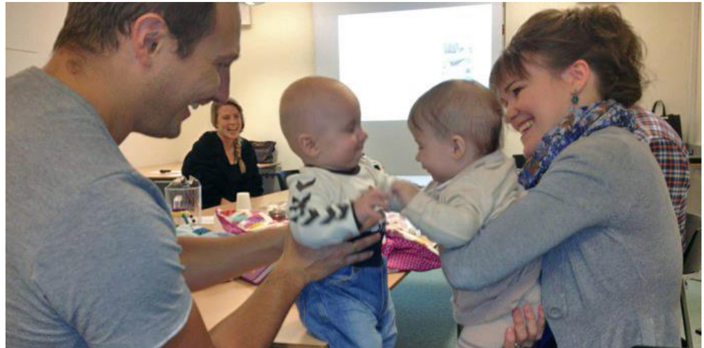
I Holstebro Kommune får alle førstegangsførelse tilbudt et undervisningsforløb i projektet Familie med Hjerte . Udover sundhedsplejersken, der står for forløbet, møder de førstegangsfødende blandt andre jordemødre, jurister, bankrådgivere, socialrådgivere og tandplejere og der er også mulighed for at få en tolk med til undervisningen.