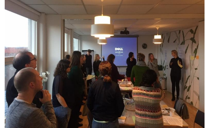
På temagruppemødet var der fælles drøftelse af, hvad der er vigtigt ift. arbejdet med dokumentering og evaluering i udsatte boligområder