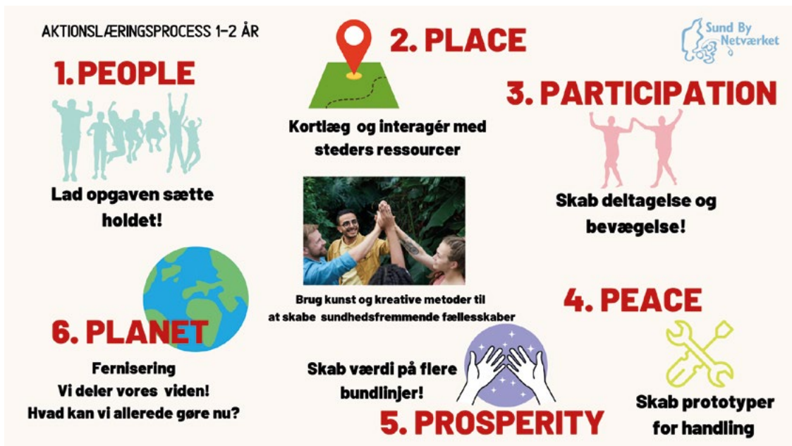
Figur 3. De 6 P'er i Kulturens Rige.