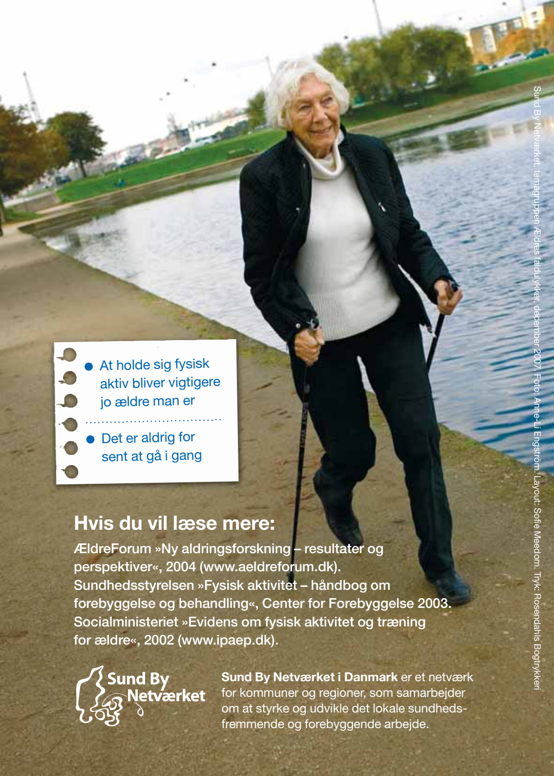
Sund By Netværket, temagrupperen Ældres faldulykker, december 2007. Layout: Sofie Meedom. Tryk: Rosenhøjs Bogtrykkeri